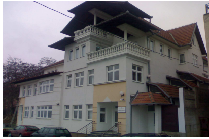
Зграда Економског факултета у К. Митровици

Економски факултет Универзитета у Приштини функционише четрдесет седам година. То је довољно дуг временски период за оцену досадашњег рада и назнаке реперних кордината будућег развоја ове научно образовне институције. Нема сумње, четрдесет девет година рада за оне који су склони да упоређују развој институције са животним веком, рекли бисмо да је Факултет достигао фазу своје зрелости. Истина, од свог оснивања до данас Факултет је пролазио кроз многа искушења делећи при том судбину своје